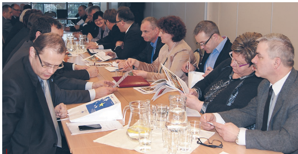
Członkowie ZGWM z zaciekawieniem studiowali dwa ostatnie numery „Bez Wierszówki”

i integracji regionu”. Postanowiliśmy zebrać podstawowe dane o wszelkich lokalnych mediach (nie tylko drukowanych). Informacje te posłużą także do umożliwienia spotkań i poznania się wydawców i redaktorów tej prasy, wymiany informacji i upowszechniania lokalnych dobrych praktyk w całym województwie.